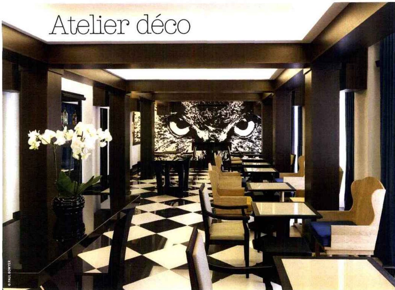
La réception, à la fois salle de petit déjeuner et espace de travail, avec son hibou réalisé par l'artiste Victor Ash .