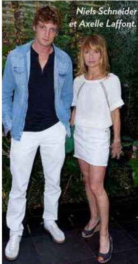
Niels Schneider et Axelle Laffont.