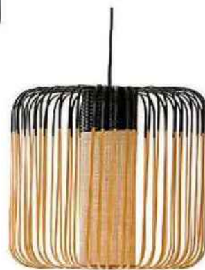
Suspension en bambou, Bamboo, Leroy Merlin, 182 €.