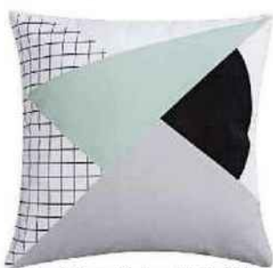
Coussin Geometric, Leroy Merlin, 9,90 €.