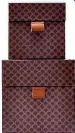
Boîtes en carton, languette en cuir, Ray, House Doctor, 29 € le set de 2.