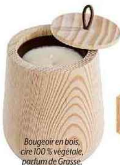
Bougeoir en bois, cire 100 % végétale, parfum de Grasse, rechargeable, 6 parfums au choix, Origin, Botanic, 32,50 €.