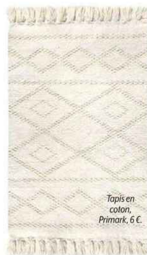
Tapis en coton, Primark, 6 €.