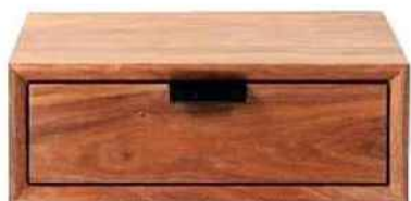
Chevet Berkley, Maisons du Monde, 150 €.