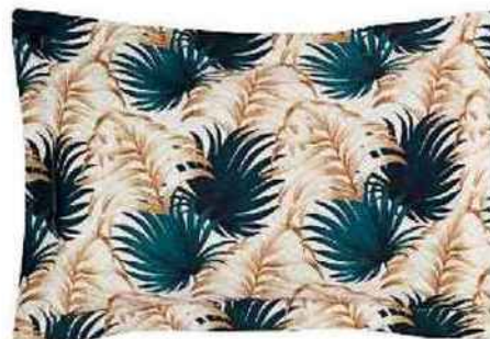
Taie d'oreiller, 50 x 75 cm, en satin de coton, Palmae Mariée, Descamps, 70 €.