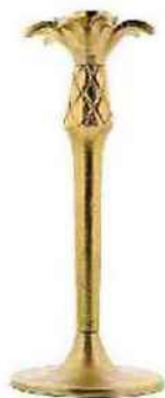
Bougeoir Pineapple, Bouchara, 24,99 €.