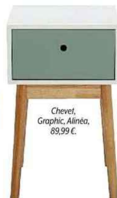
Chevet, Graphic, Alinéa, 89,99 €.