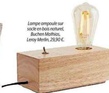
Lampe ampoule sur socle en bois naturel, Buchen Mathias, Leroy Merlin, 29,90 €.