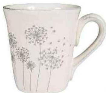
Mug en porcelaine, Côte Table, 11,50 €.