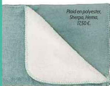
Plaid en polyester, Sherpa, Hema, 17,50 €.