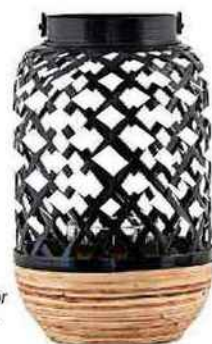
Lanterne en bambou et verre, Breeze, House Doctor sur madeindesign. com, 34 €.