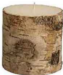
Bougie, bois de bouleau et cire de soja, Broste Copenhagen, 12 €.