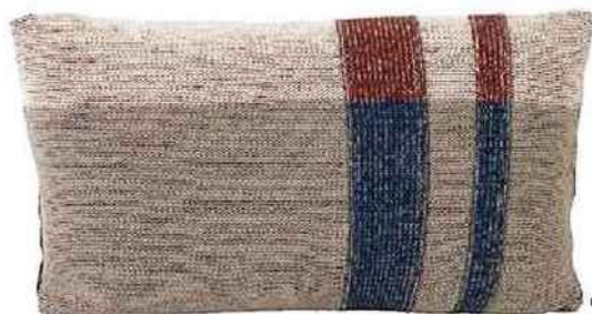
Coussin en coton bio tricoté, rembourrage en plumes, Medley, Fermiliving sur pure-deco.com, 54 €.