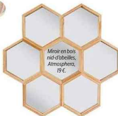
Miroir en bois nid-d'abeilles, Atmospha, 19 €.