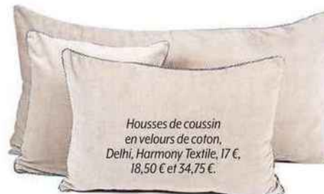
Housses de coussin en velours de coton, Delhi, Harmony Textile, 17 €, 18,50 € et 34,75 €.

Suite L'île aux Oiseaux par Delphine Manivet, Les Sources de Caudalie.