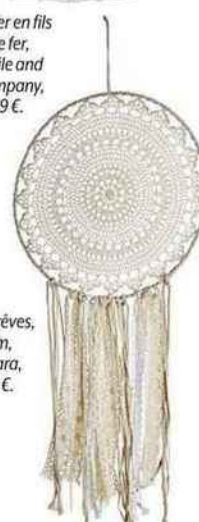
Attrape-rêves, Dream, Bouchara, 24,99 €.