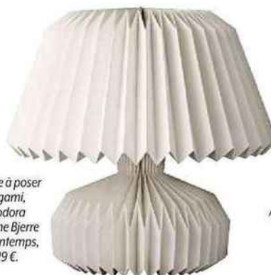
Lampe à poser origami, Leodora de Lene Bjerre au Printemps, 129 €.