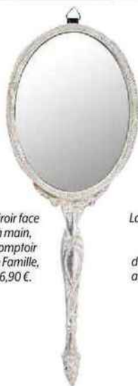
Miroir face à main, Comptoir de Famille, 16,90 €.