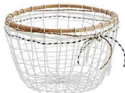
Panier en fils de fer, Etoile and Company, 19 €.