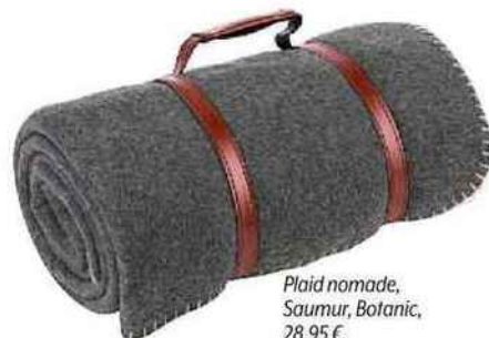
Plaid nomade, Saumur, Botanic, 28,95 €.