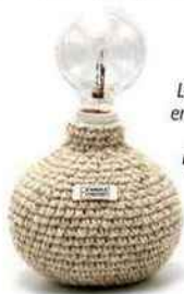
Lampe à poser en textile tricoté. Hook sur lightonline.fr , 110 €.