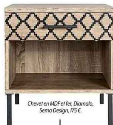
Chevet en MDF et fer, Diamalo, Sema Design, 175 €.